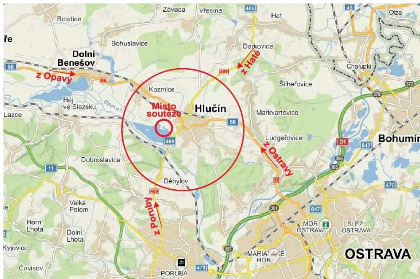
obr. 1 - oblast Hlučínka s jezerem